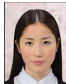
背景に柄があるもの