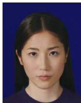
背景の色がきつく人物を特定しづらいもの