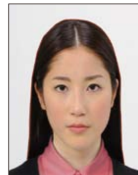
✕ 変形やマスクングなどの画像処理を施したもの

頭髪のボリュームが極端に大きな場合には、下図に示すように「両眼の中心から頭頂までの距離」は「両眼の中心から顎までの距離」と等しいものとみなして、トリミングしてください。