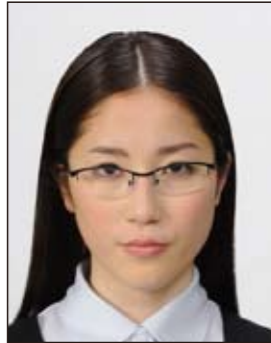
✕ 眼鏡のフレームが目にかかっているもの

今後、出入国審査等で旅券に内蔵されている IC チップに記録された顔画像とその旅券を提示した人物の顔を電子機器等で照合することが見込まれ、眼鏡のフレームや照明の反射が目にかかっているものやフレームが非常に太いものなどは、照合の妨げとなる可能性がありますので注意が必要です。