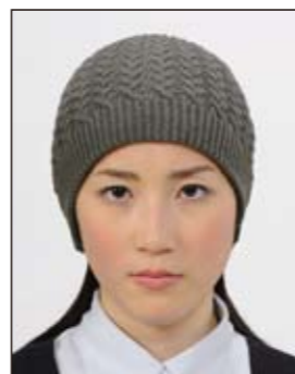
帽子によって頭部が隠れているもの