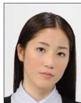
顔が左右に傾いているもの