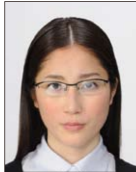
✕ 照明が眼鏡に反射したもの

撮影時にピントが合っていなかったり、手ブレしてしまったために画像が不鮮明なものや背景に人物の影があるものは不適当です。