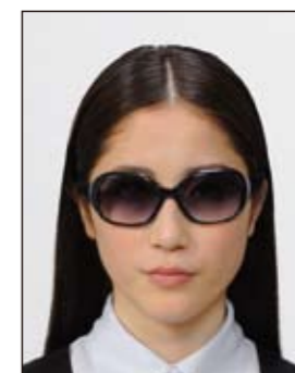
サングラスをかけ人物を特定できないもの