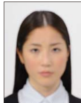
✕ ピンボケや手ブレにより不鮮明なもの

撮影時にピントが合っていなかったり、手ブレしてしまったために画像が不鮮明なものや背景に人物の影があるものは不適当です。