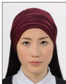
幅の広いヘアバンド等により頭部が隠れているもの