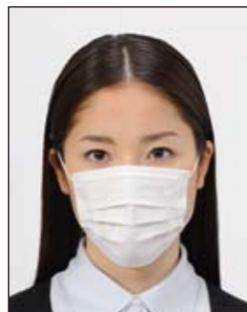
✕ 顔の器官が隠れる装飾品等があるもの