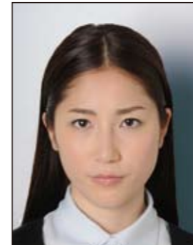
✕ 背景に影があるもの

デジタル印刷の場合、ドット（網状の点）やジャギー（階段状のギザギザ模様）、インクのにじみなどがみられるものは不適当です。写真専用紙等を使用し、鮮明な画質で印刷してください。