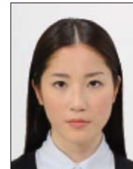
✕ ジャギーがあるもの

眼鏡やヘアバンド以外にも、帽子や衣服、布、マスク、イヤリング、カチューシャなど顔の器官が隠れるような大きめの装飾品等は好ましくありません。なお、顔の器官を隠さず髪を上げるため等の小ぶりの装飾品は受理しますが、着ける箇所によっては不適当となる場合があります。大きさ等の判断に迷う場合は装飾品をはずした写真をお持ちください。