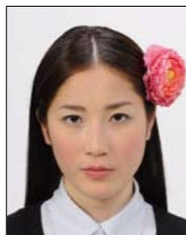
✕ 顔や頭の輪郭が隠れる装飾品等があるもの

画像ファイルの過剰な圧縮等が原因となってノイズ（画像の乱れ）が発生しているもの、変形やマスクング（縁取り）などの画像処理を施したものは不適当です。