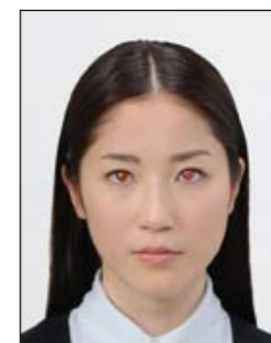
瞳がフラッシュ等により赤く写ったもの