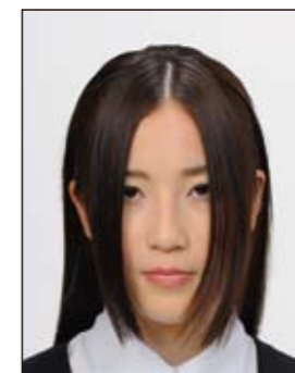
前髪が長すぎて目元が見えないもの 顔の輪郭が隠れるもの