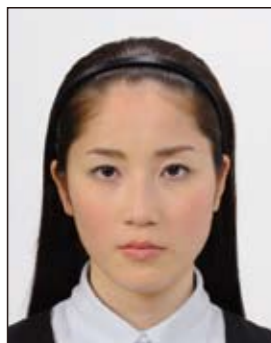
○ 顔の器官を隠さず、小ぶりのもの

眼鏡やヘアバンド以外にも、帽子や衣服、布、マスク、イヤリング、カチューシャなど顔の器官が隠れるような大きめの装飾品等は好ましくありません。なお、顔の器官を隠さず髪を上げるため等の小ぶりの装飾品は受理しますが、着ける箇所によっては不適当となる場合があります。大きさ等の判断に迷う場合は装飾品をはずした写真をお持ちください。