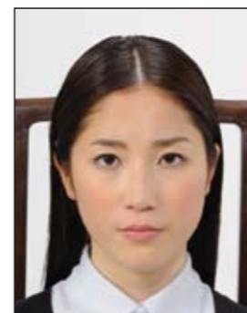
椅子等背景があるもの