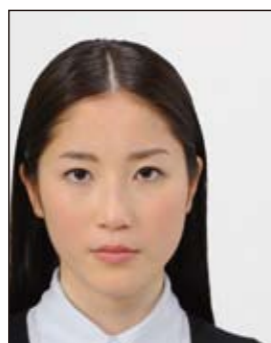
顔の位置が片寄っているもの