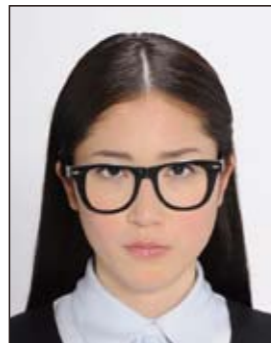
✕ フレームが非常に太く目や顔を覆う面積の大きいもの