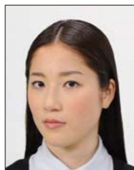
顔が横向きのもの