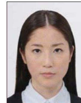
✕ ドットやインクのにじみなどがあるもの

デジタル印刷の場合、ドット（網状の点）やジャギー（階段状のギザギザ模様）、インクのにじみなどがみられるものは不適当です。写真専用紙等を使用し、鮮明な画質で印刷してください。