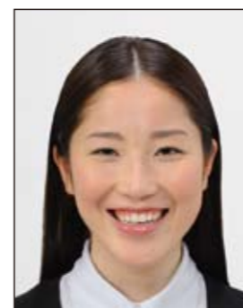
平常の顔貌と著しく異なるもの