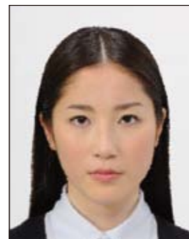
✕ ノイズがあるもの

画像ファイルの過剰な圧縮等が原因となってノイズ（画像の乱れ）が発生しているもの、変形やマスクング（縁取り）などの画像処理を施したものは不適当です。